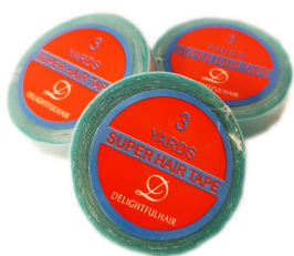
Delightful Super Hair Tape - Tejprulle 119 kr