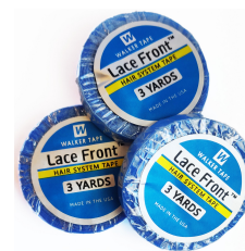
Walker tejprulle 149 kr