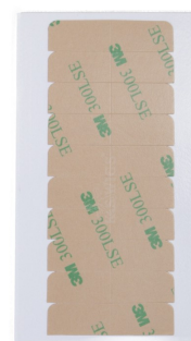
Extra tejp till löshår 3M 10 bitar 39 kr